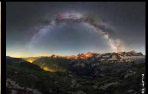
PARC NATIONAL DES PYRÉNÉES

↳ 1 er étage du Cinéma / salle des Pas Perdus